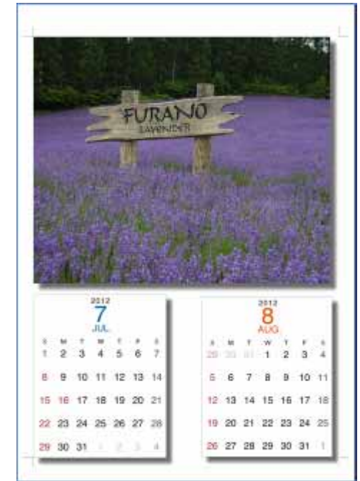
玉 = 標準