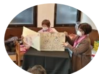
よみきかせ紙ふうせん

スタンプラリー形式で 14 チームを回って、日頃の活動を地域 の皆さんに紹介しながら楽しんでもらいました。スタッフを 入れて 170 名の参加でした。仲間づくり、地域交流へどうぞ 皆さまの一步をお待ちしています。