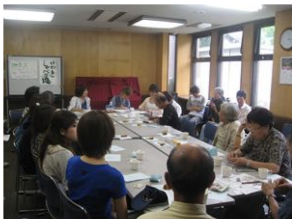
講演のあとに行われた懇談会の様子